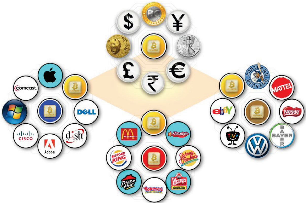
BitShares 货币交易所（BitShares Currency Exchange, BSCurEx）和三种潜在的 BSEX 链

每个这样的块链被称为 比特股交易所 （BitShares Exchange, BSEx）。而块链的总体被称为 比特股自由市场系统 （BitShares Free Market System, BSFMS）。BSFMS 被设计作为独立竞争/自由合作的市场实体成长，并不断建立新的与 比特股 兼容的 BSEx，将会因满足市场需求而获益。四个这样的 BSEx 组成了图示的 BSFMS。每个 BSEx 最多可有 32 个加密货币一加上本地和全局的 比特股 货币。每个 BSEx 有自己的块链来支持加密货币并以本地 比特股 货币来命名（以红，绿，蓝 比特股 表示），这些本地 比特股 可以在本地与构成货币 BSEx 本地标准的全局 比特股 （黄色）交易。